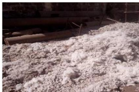
Photo 4: Dépôt de déchets de coton destinés au fabricant de matelas